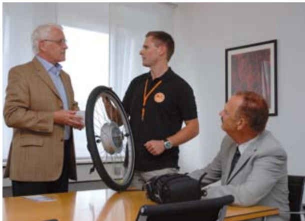
Senior-Experte beraten junge Existenzgründer.

Eng ist die Kooperation mit der rubitec GmbH, der Gesellschaft für Innovation und Technologie der Ruhr-Universität Bochum; seit zehn Jahren ist sie als Technologietransfergesellschaft an der Schnittstelle zwischen Wissenschaft und Wirtschaft kommerziell tätig. Gemeinsam mit den Universitäten und der IHK ist die rubitec Projektpartner der